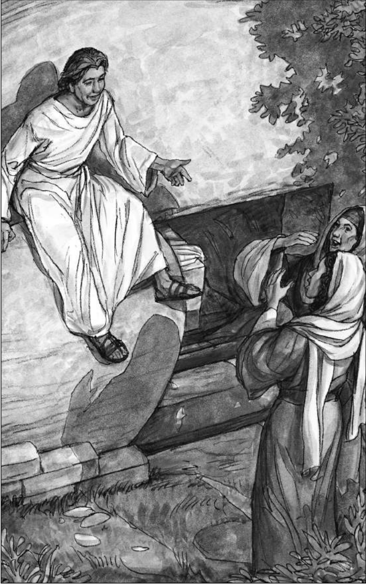
Bir melek kadınlara İsa Mesih'in ölümünden dirildiğini haber veriyor