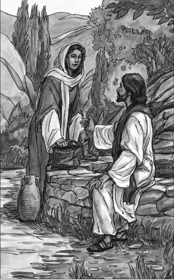
Mesih İsa kuyu başında Samiriyeli kadınla konuşuyor.