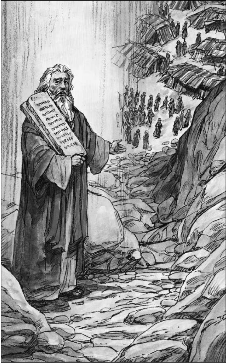
Tanrı Musa'ya On Emir verdi.