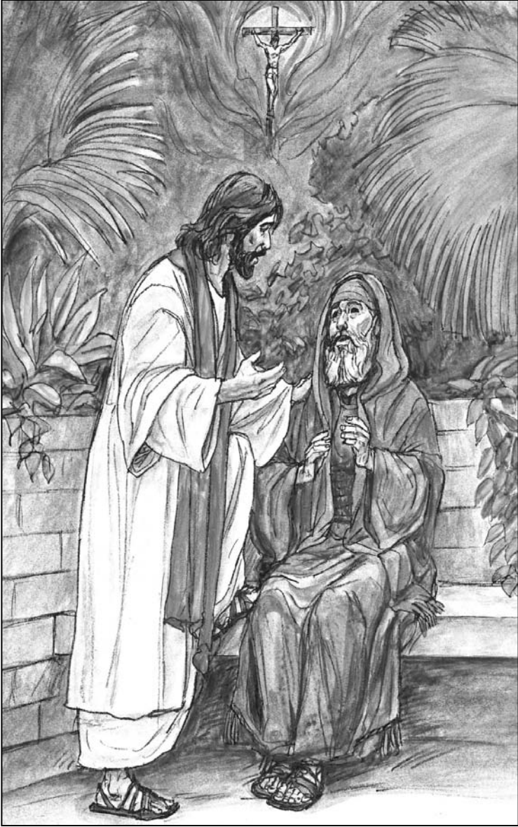
İsa Nikodemus'a yeniden doğması gerektiğini anlatıyor.